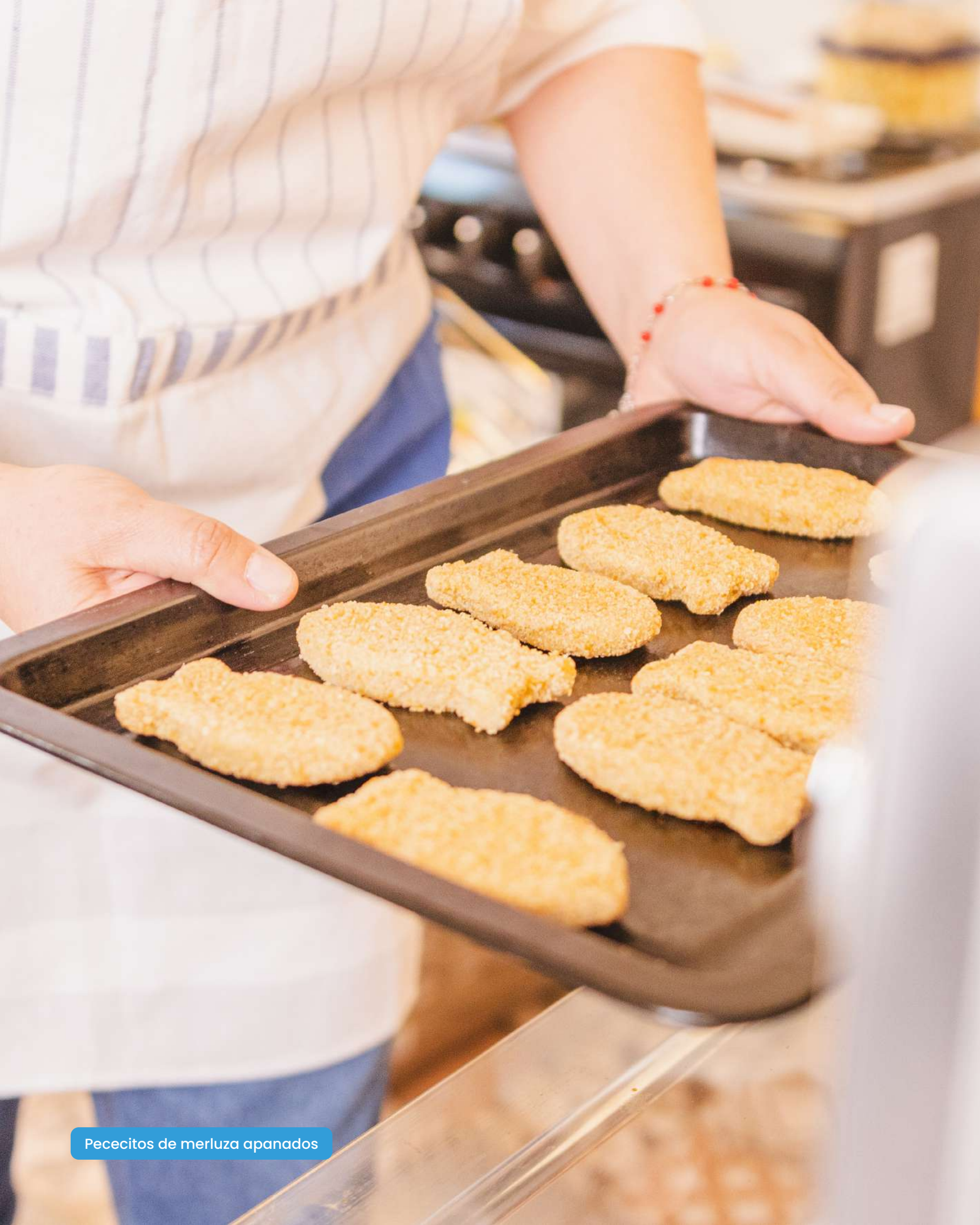
Pececitos de merluza apanados